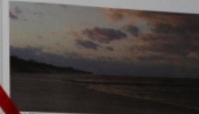
Plac SP Kołobrzeg

Szeregowe Powiatowe Biuro Kołobrzegi Plac Rybacki 1 76-100 Kołobrzeg tel. +48 94 354 76 18 fax +48 94 354 49 42 starosta@powiat.kolobrzeg.pl www.powiat.kolobrzeg.pl